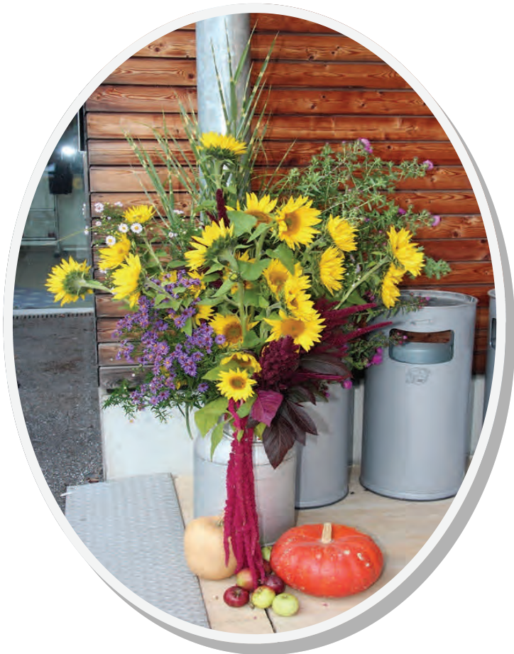
Danke für die schöne Dekoration!