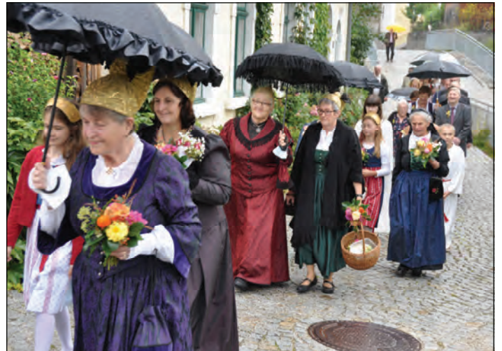
Dank an die Goldhauben- und Trachtengruppe St. Nikola