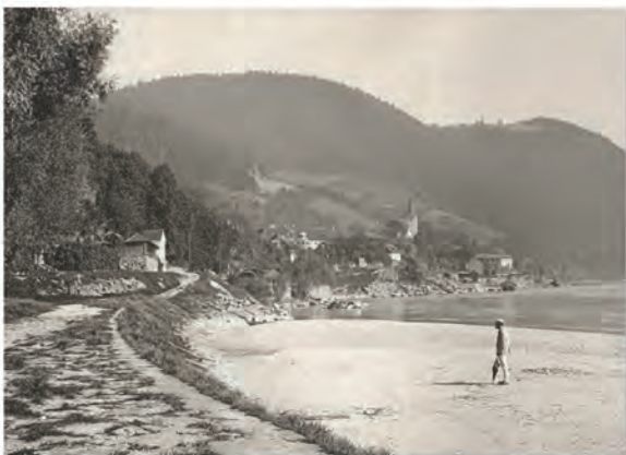
St. Nikola am weißen Donastrand um 1900

Über 120 historische Fotos und Bilder vermitteln eindrucksvoll unsere Gegend, wie sie vor dem alles verändernden Kraftwerksbau Ybbs-Persenbeug aussah.