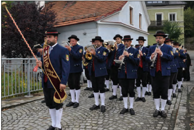
Die Musikkapelle führt den Festzug an.

benberger für die musikalische Gestaltung des Festgottesdienstes, den Pfarrgemeinderatsmitgliedern für die Agape nach dem Gottesdienst, Fotograf Josef Zeitlhofner und Herrn Pfarrer Msgr. Berthold Müller.