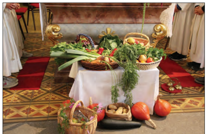
Obst und Gemüse wurde vor dem Altar zur Segnung aufgestellt.