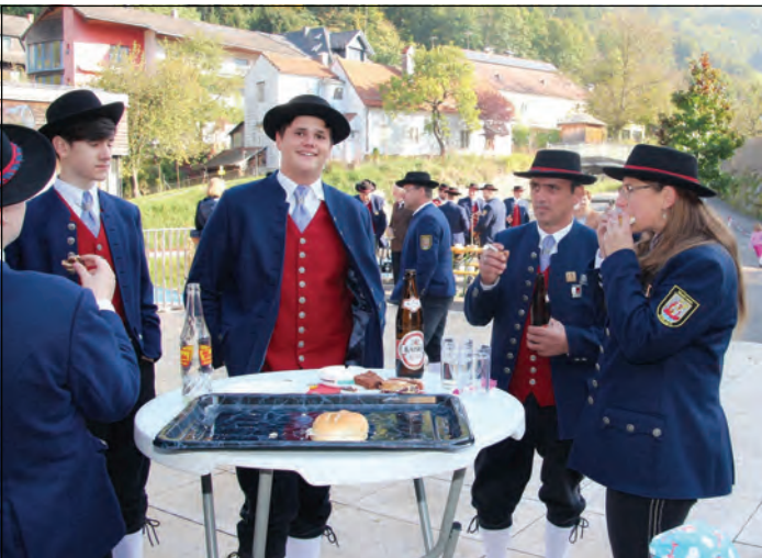
Für die Musiker/innen gab es Wurstsemmeln und Getränke zur Stärkung.