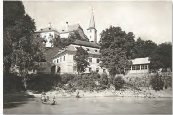
Der Gasthof Fannenböck mit Nikolauskirche und Pfarrhof

Im Abschnitt über Struden und St. Nikola finden sich Beiträge über die Gießenbachmühle, den Strudel und Wirbel, die Burg Werfenstein, das Marienbad, die Nikolauskirche und die Wassersammlung.