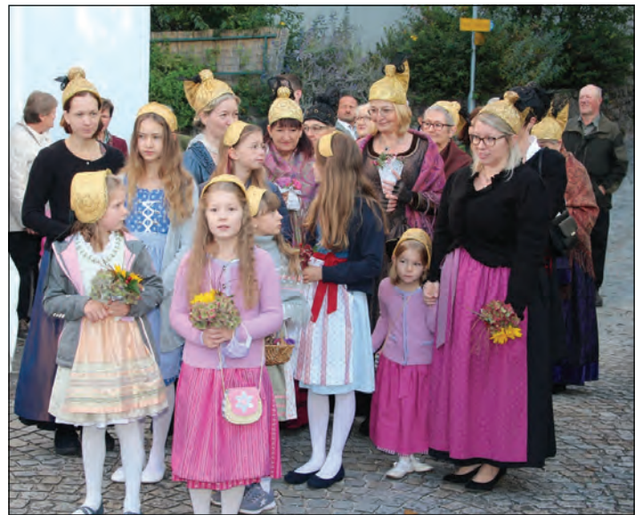
die Teilnehmerinnen der Goldhauben- und Trachtengruppe